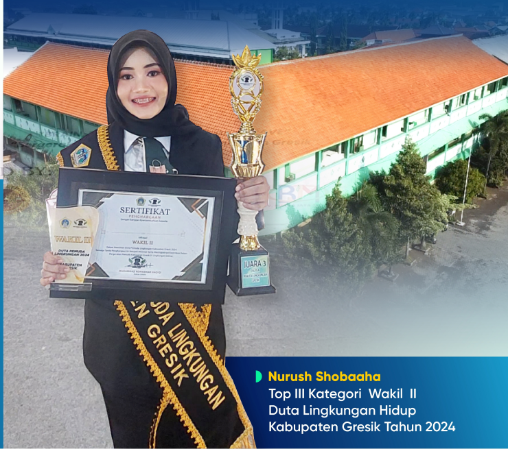
► Nurush Shobaaha Top III Kategori Wakil II Duta Lingkungan Hidup Kabupaten Gresik Tahun 2024

Untuk meningkatkan kualitas pendidikan, Institut Agama Islam Daruttaqwa Gresik bekerjasama dengan berbagai lembaga dan instansi, diantaranya: ISDEV Malaysia, Bank Jatim Syari'ah, Baznas, Instansi Pendidikan, Perbankan, dan lain-lain.